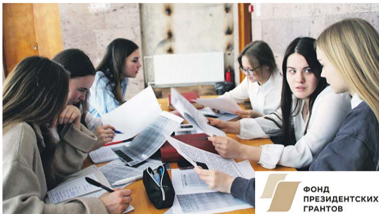
Участники проекта ведут активный сбор информации.

В настоящее время при помощи собранного архивного