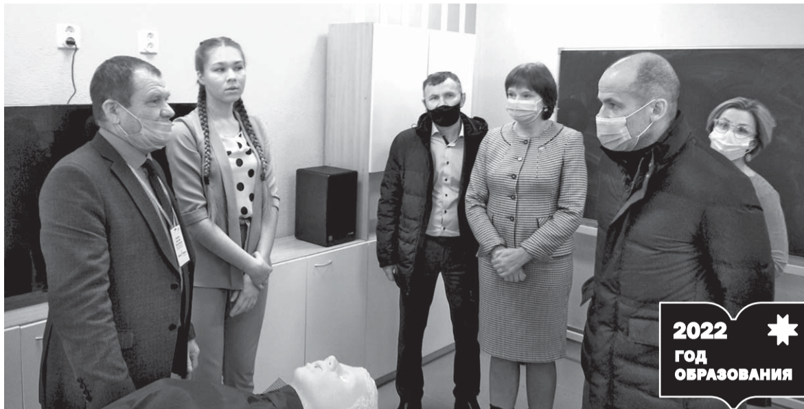
Глава УР Александр Бречалов знакомится с Центром образования «Точка Роста» Селтинской средней школы.

Президент России Владимир Путин, говоря о важности предложенного им национального проекта «Образование», сказал, что российское образование должно готовить специалистов нового технического уклада, учащиеся в разных населённых пунктах должны иметь равные возможности для самореализации.