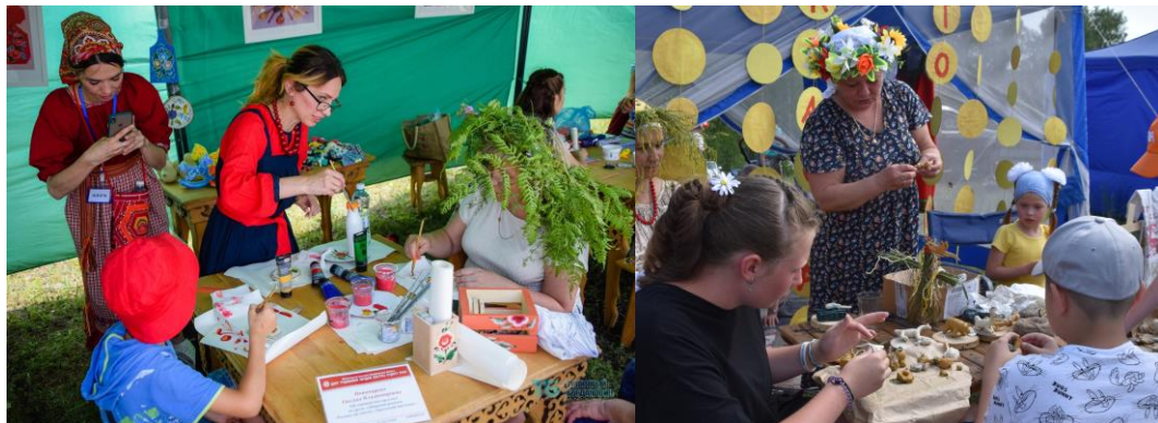
Приняли участие в мастер-классах по различным видам народных художественных промыслов