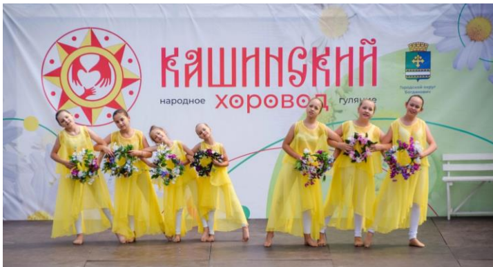
Детские коллективы стали участниками концертной программы