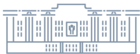
Музей изобразительных искусств имени С.Д. Эрьзи