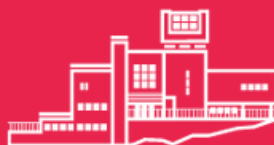
Детская художественная школа №1 имени П.Ф. Рябова