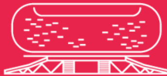
Стадион «Мордовия Арена»