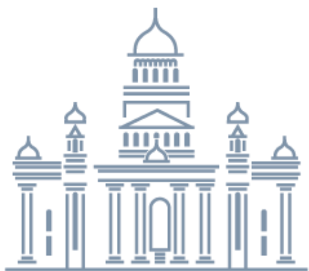
Кафедральный собор святого праведного воина Феодора Ушакова