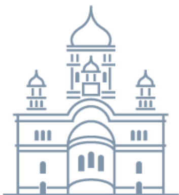
Храм святых равноапостольных Мефодия и Кирилла