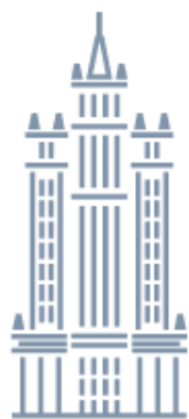
Мордовский государственный университет им. Н. П. Огарёва