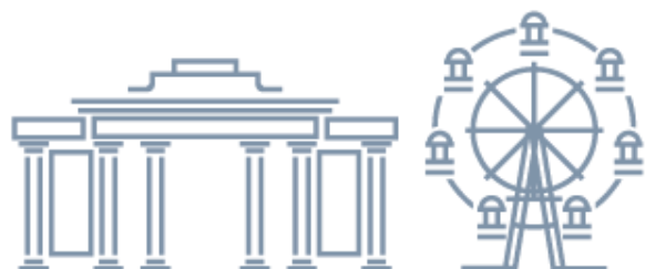
Парк им. А. С. Пушкина