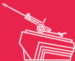
Памятник Подольским курсантам