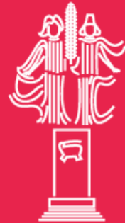
Монумент «Навеки с Россией»