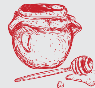
Мед с собственной пасеки