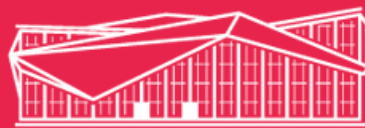
АО «Международный аэропорт Саранск»