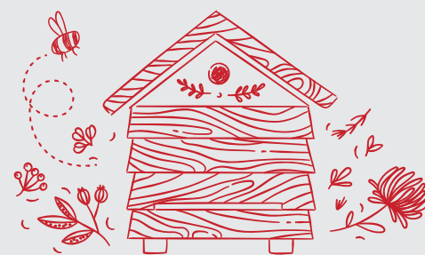
Ч Апидомика Дом Пчеловода Пчелиная мастерская

А Apis Village в переводе «Пчелиная деревня» - новый эко-проект и уникальное место в Республике Мордовия, где нет городского шума, Интернета и мобильной связи. А главные хозяева - пчелы, которые наполняют здоровьем и энергией!