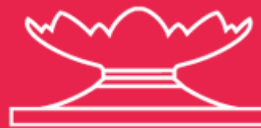
Фонтан «Каменный цветок»