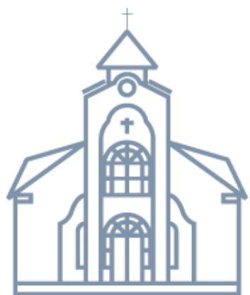
Церковь евангельских христиан «Благодать»