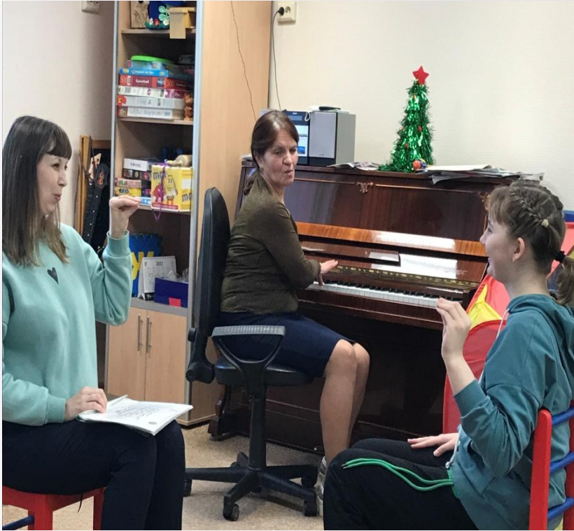
Поём гласные Обучаем родителей