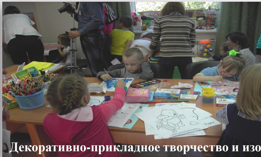
Декоративно-прикладное творчество и изо