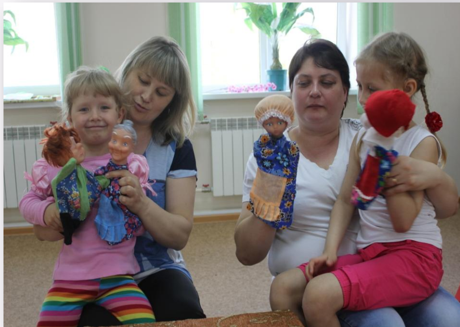
Дети слабослышащие и после кохлеарной имплантации