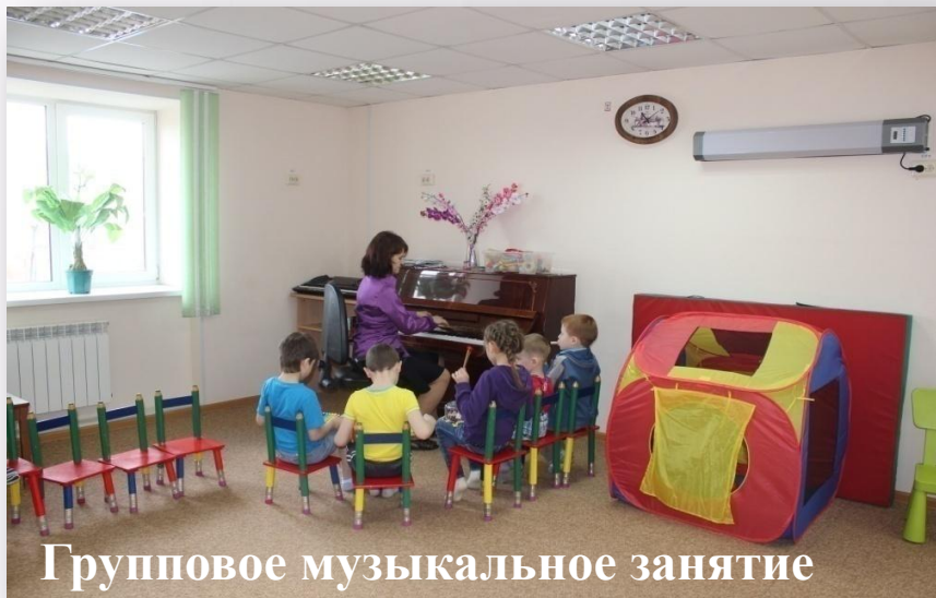
Групповое музыкальное занятие