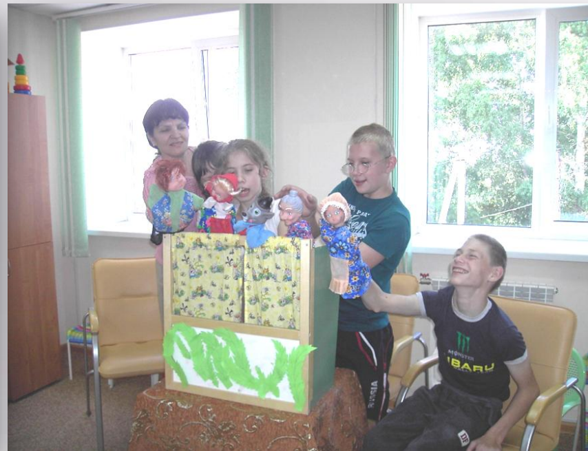
Дети с ДЦП и двигательными нарушениями