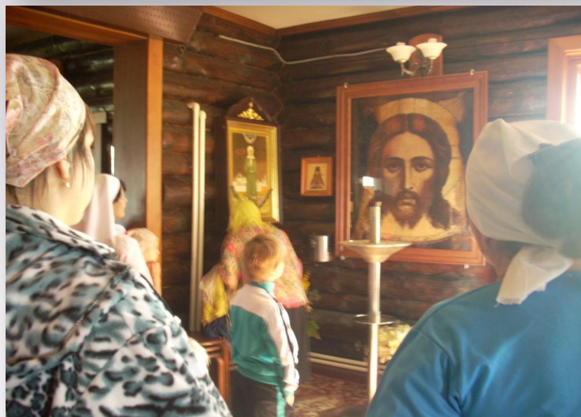
Приход во имя св. Семеона Верхотурского