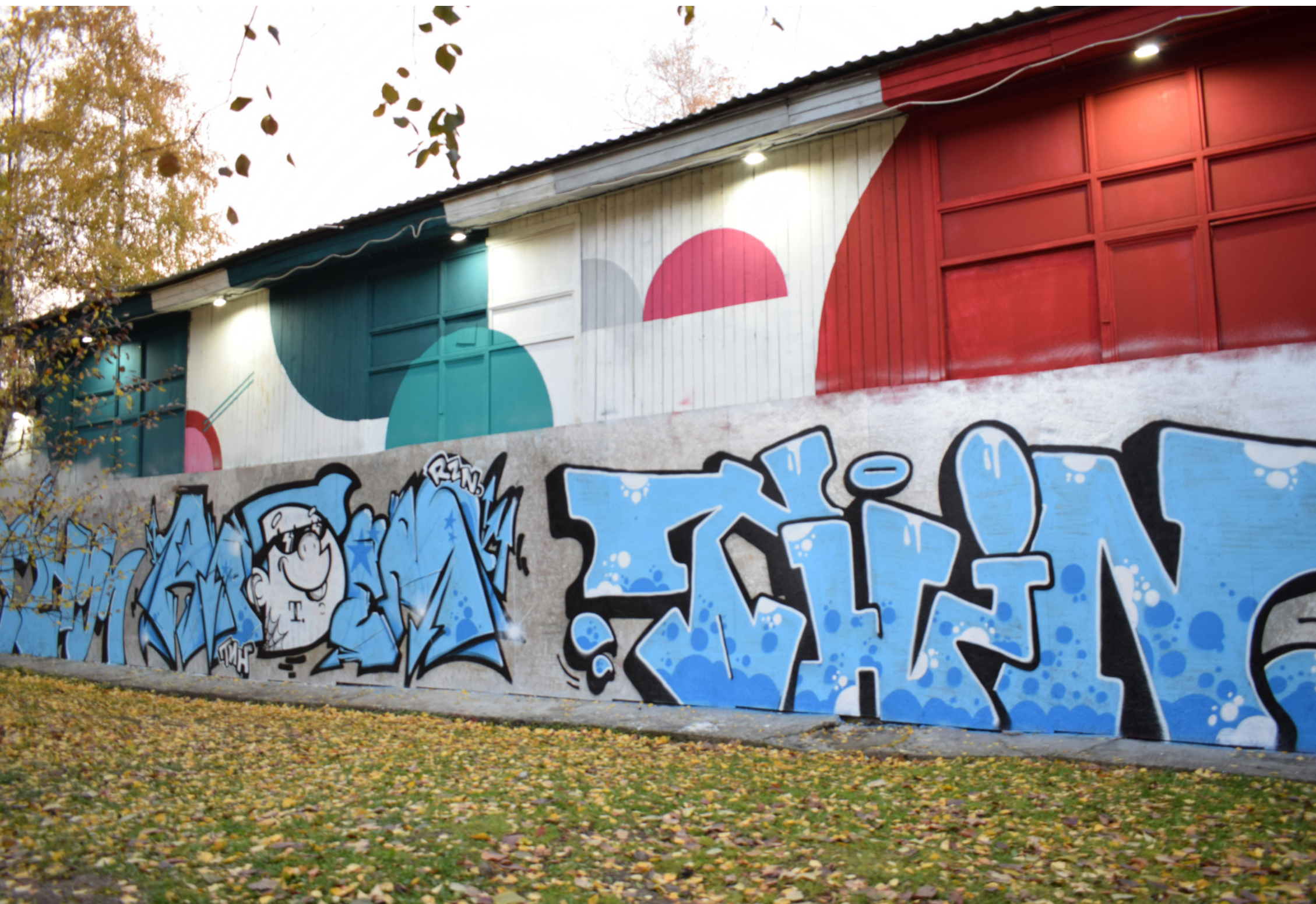
Галерея уличного искусства «100 квадратов»