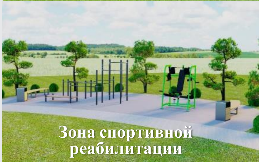
Зона спортивной реабилитации