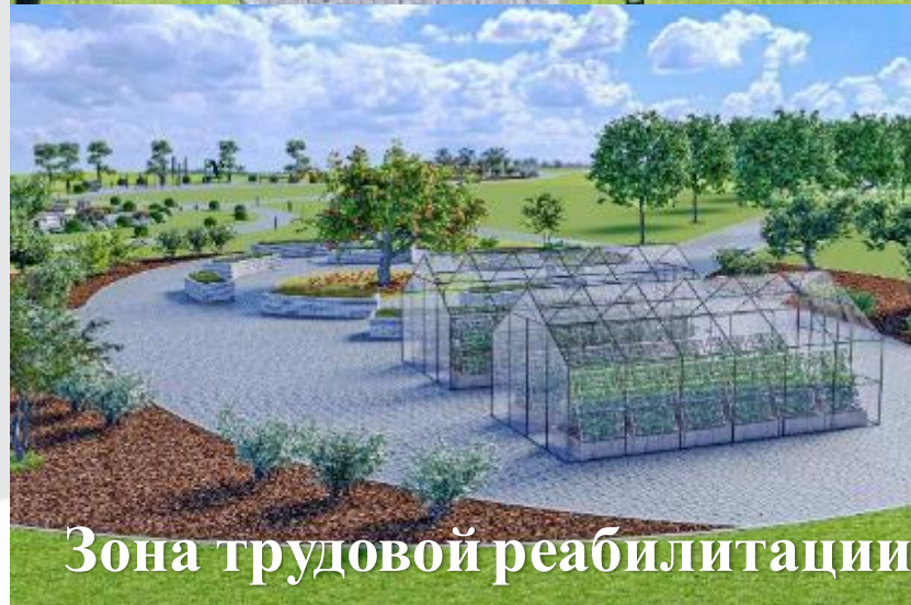
Зона трудовой реабилитации