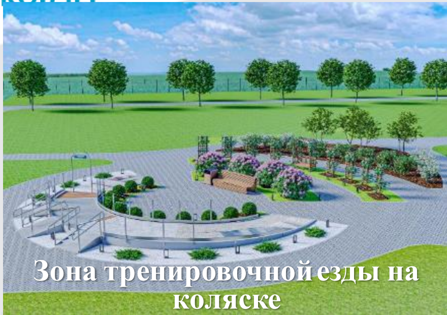
Зона тренировочной езды на коляске