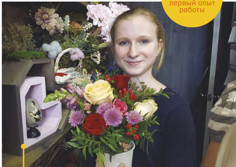
Флорист – салон «Вам букет»