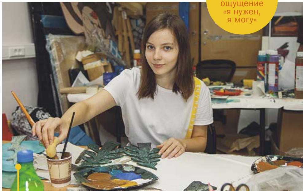
Ассистент художника-декоратора – киностудия «Союзмультфильм»