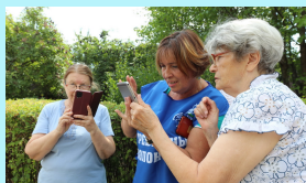
Освоение современных технологий

Следите за нашими новостями в социальных сетях: