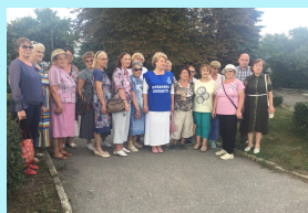
Экскурсионные программы и походы