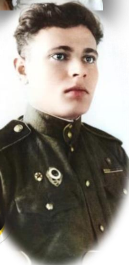
...я служила в том с...