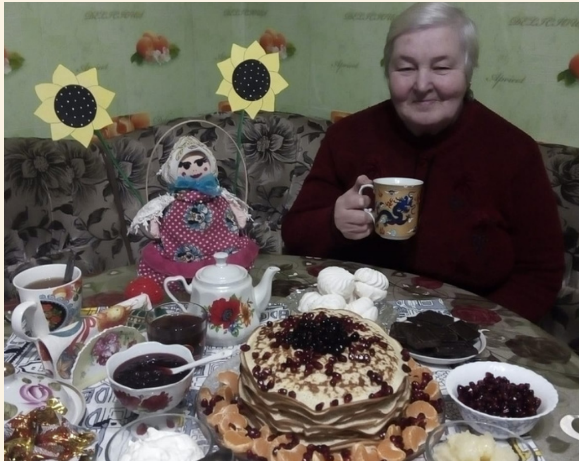
Конкурс людей старшего поколения с блинным столом.

Социальные работники помогли гражданам пожилого возраста празднично накрыть стол и проводить Масленицу горячими золотистыми блинами, также в результате конкурса «на свет» появились симпатичные маленькие куколки-масленки, и, конечно, без главного символа - чучела Масленицы дело не обошлось. Конкурс удался на славу и порадовал всех! Каждый участник остался счастлив и доволен прошедшему празднику, а также рад памятного призу.