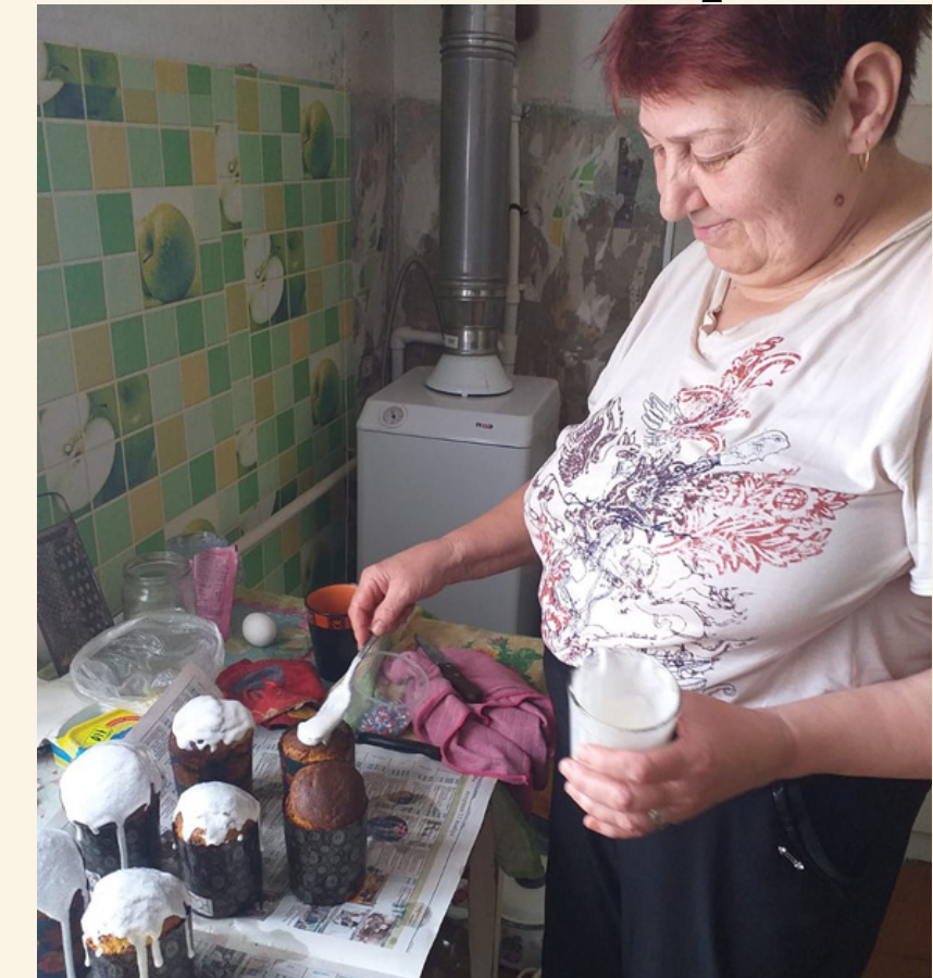
Конкурс фото пожилых людей с куличами и пасхальными яйцами.

Конкурсные фотографии всецело отразили настроение чудесного христианского праздника. С большим удовольствием делились получатели социальных услуг своими писанками, крашенками и куличами. Конкурс получился радостным, воспевающий жизнь и любовь.