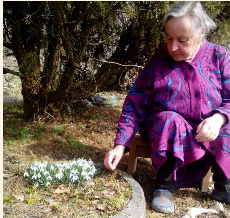
Конкурс фото с первыми цветами, на приусадебном участке.

Весенним настроением поделились участники конкурса. Получатели социальных услуг были рады показать богатство красок своих растений: белоснежные галантусы, синие пролески, желтоватые морозники, красно-желтые примулы, фиолетовые крокусы не могут не радовать душу и сердце.